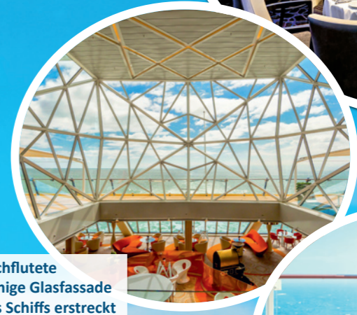
Die lichtdurchflutete diamantförmige Glasfassade am Heck des Schiffs erstreckt sich über zwei Decks.

8 Tage Polster & Pohl Jubiläums-Kreuzfahrt 20. bis 27.9.2026