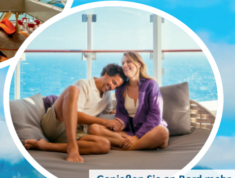
Genießen Sie an Bord mehr individuellen Platz als auf Schiffen anderer Reedereien.