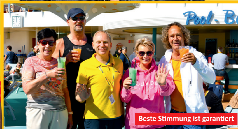
Beste Stimmung ist garantiert