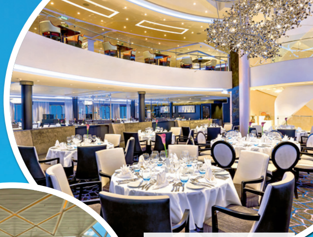
Verwöhnen Sie Ihren Gaumen mit vielfältigen exquisiten Speisen und Getränken kostenfrei in den verschiedenen Restaurants.